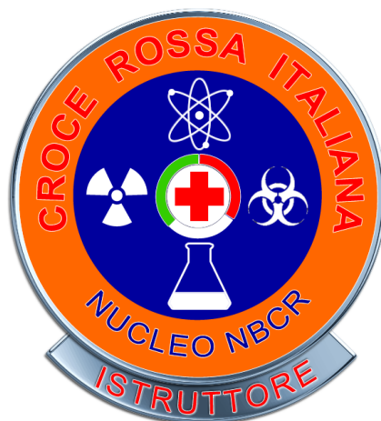
Istruttore NBCR (Fac-simile)

In alternativa il distintivo può essere realizzato in metallo. In questo caso dovrà avere un diametro di mm. 35, e rispettare proporzionalmente dimensioni colori e simboli. La parte superiore potrà essere protetta con resina trasparente. Sul retro del distintivo, in posizione centrale dovrà essere previsto un sistema di fissaggio tipo "pinces" a due alette.