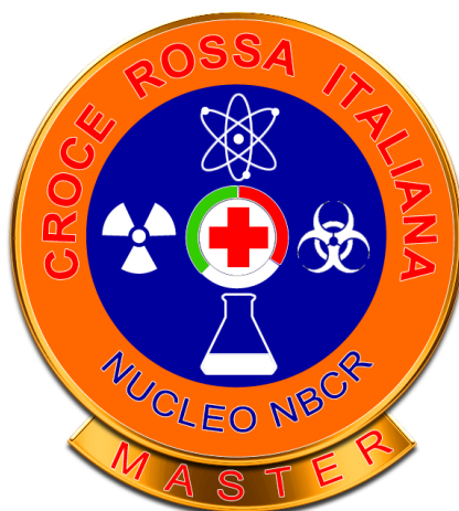
Maestro Istruttore NBCR (Fac-simile)

In alternativa il distintivo può essere realizzato in metallo. In questo caso dovrà avere un diametro di mm. 35, e rispettare proporzionalmente dimensioni colori e simboli. La parte superiore potrà essere protetta con resina trasparente. Sul retro del distintivo, in posizione centrale dovrà essere previsto un sistema di fissaggio tipo "pinces" a due alette.