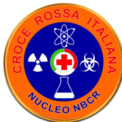
Operatore NBCR (Fac-simile)

In alternativa il distintivo può essere realizzato in metallo. In questo caso dovrà avere un diametro di mm. 35, e rispettare proporzionalmente dimensioni colori e simboli. La parte superiore potrà essere protetta con resina trasparente. Sul retro del distintivo, in posizione centrale dovrà essere previsto un sistema di fissaggio tipo "pinces" a due alette.