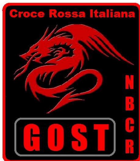
Gruppo Operativo di Supporto Tattico –GOST (fac-simile)

Sul retro del distintivo metallico, sono previste due propaggini appuntite lunghe mm. 7 atte a trapassare il bavero di una giacca e dotate di un sistema di fissaggio tipo "pince" a due alette, idonee a mantenere il distintivo in posizione corretta.