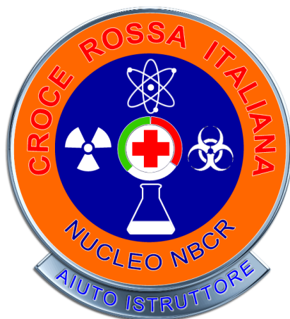
Aiuto Istruttore NBCR (Fac-simile)

In alternativa il distintivo può essere realizzato in metallo. In questo caso dovrà avere un diametro di mm. 35, e rispettare proporzionalmente dimensioni colori e simboli. La parte superiore potrà essere protetta con resina trasparente. Sul retro del distintivo, in posizione centrale dovrà essere previsto un sistema di fissaggio tipo "pinces" a due alette.