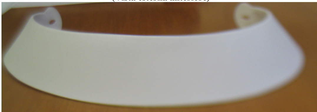
Fig. 1.1 (Vista esterna anteriore)