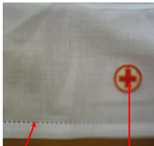
Fig. 1.4 (vista posteriore)