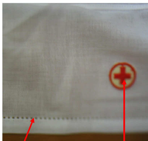
Fig. 1.4 (vista posteriore)