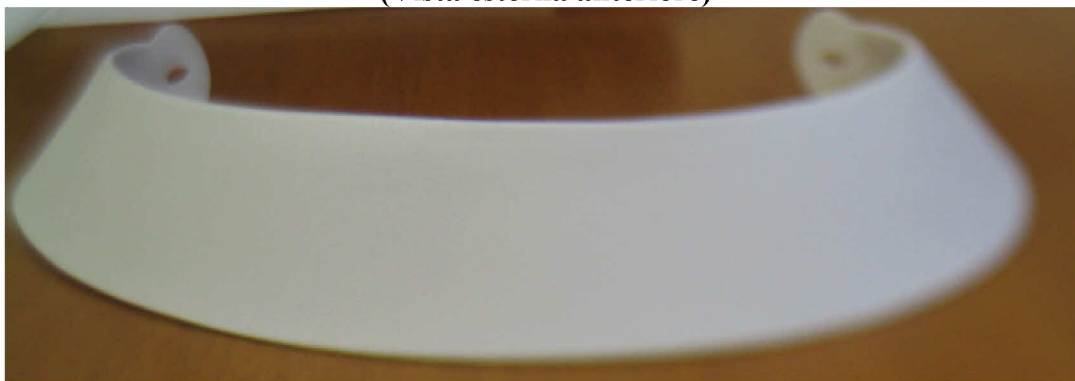
Fig. 1.1 (Vista esterna anteriore)